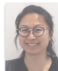
CÉCILE MA CE1C + SI